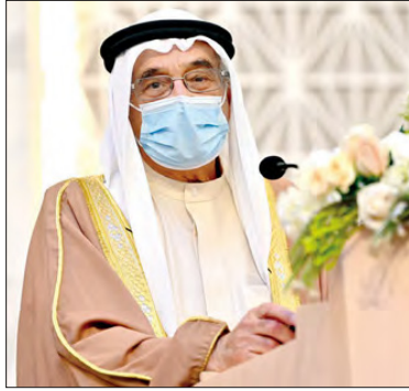
الشيخ محمد بن عبدالله

يأتي انطلاق المؤتمر، بالتزامن مع الاستعدادات النهائية لافتتاح مركز الطب التجديدي بجامعة الخليج العربي والذي يتيح أحدث التقنيات والكوادر البشرية لعلاج العديد من الأمراض المستعصية بواسطة تصحيح الجينات، والعلاج بالخلايا الجذعية.