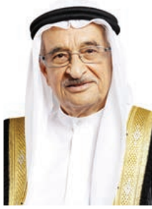
○ الشيخ محمد بن عبدالله.

الجميع في مراكز الضحض والرعاية والعلاج وتبني حملات التطعيم والتوعية وكذلك دورها الريادي والمؤثر في جميع أقسام القطاع الصحي. وأشار إلى أن مبادرات سموها منذ تشكيل المجلس الأعلى للمرأة شكل نقطة تحول في تاريخ المرأة البحرينية، ورفعها للمستوى الذي تطمح إليه من خلال تبوأ المناصب القيادية في المملكة جنباً إلى جنب للرجل في تحقيق المنجزات في العهد الزاهر لحضرة صاحب الجلالة الملك المفدى.