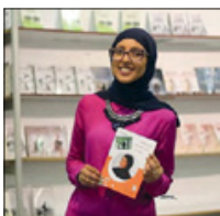
وكانت تخبرني بأن كل شعرة تسقط من رأسي أنها حسنة وأجر من الله.