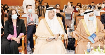
○ جانب من افتتاح المؤتمر.